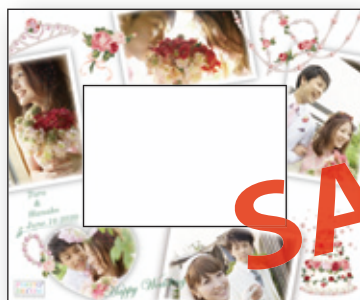
A Rose & Pearl