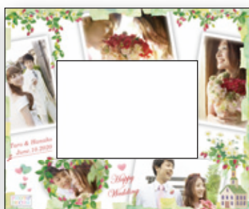
E Wild Strawberry