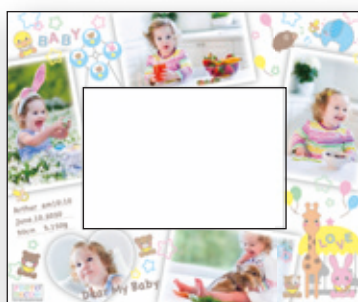
F Baby Animals