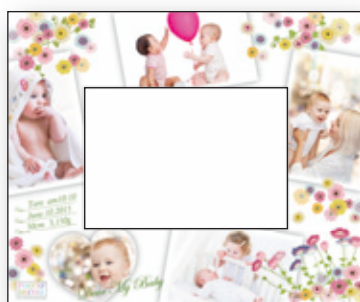
D Flower Paradise