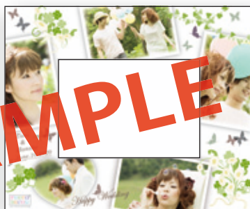
B Green & Butterfly