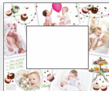
C Sweet Accessories